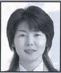
清水市代 女流三冠